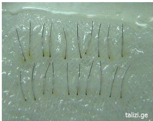
Фото 1 20 интактных монографтов