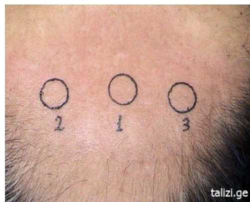
Фото 4 3 кружочка диаметром в 1 см, в области лишенной волос макушки