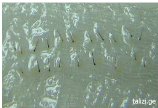
Фото 3 20 нижних половинок монографтов, перерезанных горизонтально посередине фолликулов