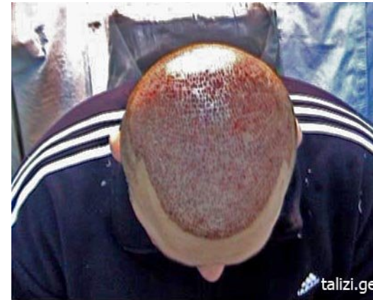
фото 8 Реципиентная область после инплантации 2490 графта