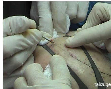
фото 2 Резиновый жгут натягивается через прикрепленные к нему рукоятки на реципиентную область вдоль линии волос. Создаются микроотверстия в вырезе жгута.