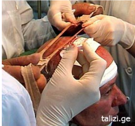
фото 4/4а Жгут с вырезом натянут за резиновыми тесьмами