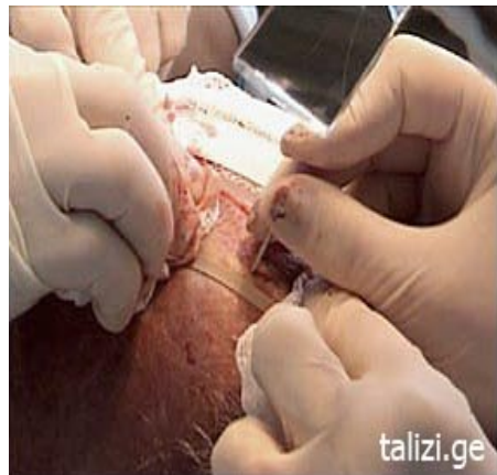
фото 5 Микроотверстия создаются в пространстве, ограниченном вырезом жгута