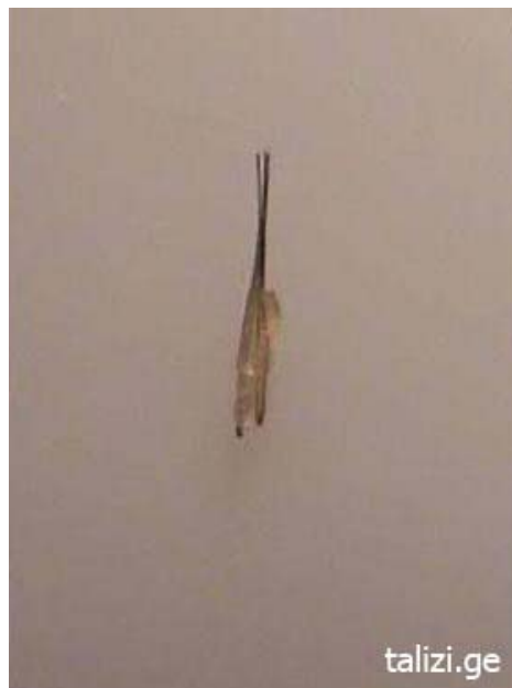
Фото 4 Тотже микрографт через 5 минут