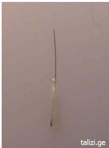
Фото 1 Монографт, только что помещенный на перчатке