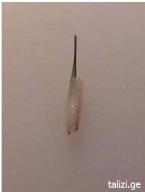
Фото 3 Микрографт, только что помещенный на перчатке