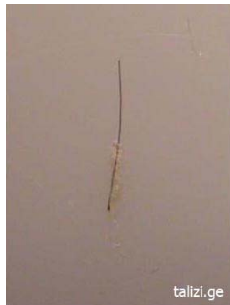
Фото 2 Тот же монографт через 5 минут